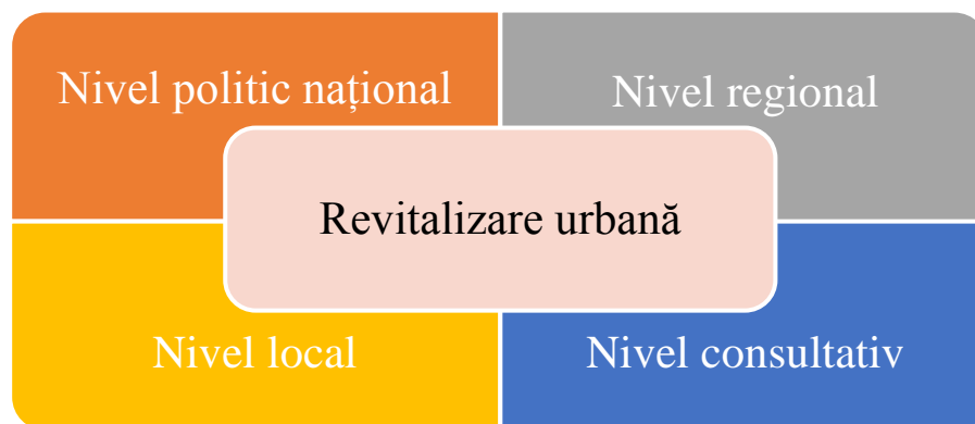
Fig. 1. Nivelele de responsabilitate

Eficiența procesului de revitalizare urbană, se caracterizează prin: cooperarea între instituțiile administrației publice la nivel central și local; cunoașterea realităților locale și identificarea măsurilor de intervenție; elaborarea și implementarea politicilor, programelor și proiectelor realiste de revitalizare urbană; parteneriate eficiente și durabile cu comunitatea locală, sectorul privat și toate părțile interesate; sprijin și deschidere către dialog cu structurile societății civile; informare și promovare.